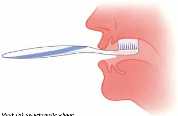
Maak ook uw gehemelte schoon

Houd behalve uw kunstgebit ook uw mond schoon. Spoel in het begin, als de wonden nog niet helemaal zijn genezen uw mond na elke maaltijd met een beetje lauw water. Daarna kunt u uw tandvles beter met een zachte tandenborstel poetsen. Gebruik daarvoor gewone fluoridetandpasta. Masseer met een zachte tandenborstel minstens één keer per dag het slijmvlies waarop uw kunstgebit rust: uw kaken en de overgang van de kaak naar de wangen. Poets ook uw gehemelte, want ook daar kunnen voedselresten zitten.