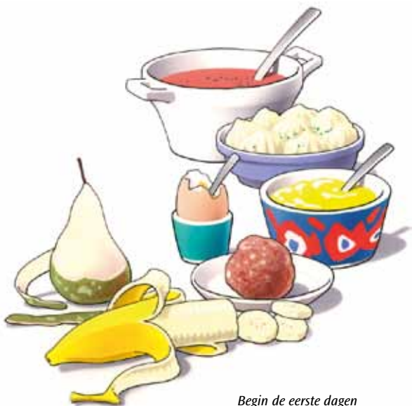
Begin de eerste dagen met zacht voedsel

Eten met uw nieuwe kunstgebit is wat onwennig. Zeker in het begin zult u voorzichtig aan doen. U ervaart zelf het beste wat wel en niet kan. Neem de eerste dagen zacht voedsel, zoals puree, gehakt en zacht fruit. Probeer enkele dagen daarna een stukje vis en een aardappel. Weer later kunt u voedsel eten zoals vlees of een appel. Stukken afbijten kunt u met een kunstgebit beter niet doen. Snijd uw voedsel daarom in stukjes en kauw rustig en gelijkmatig met uw nieuwe kunstkiezen. Neem daarbij aan beide zijden een stukje voedsel in de mond. Neem er iets meer tijd voor dan dat u gewend was.