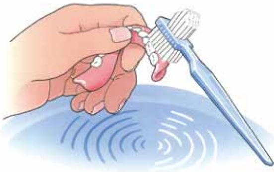
Reinig uw kunstgebit na iedere maaltijd

Uw kunstgebit is nu nog nieuw en mooi. Dat wilt u natuurlijk graag zo houden. Daarom moet u, net als bij eigen tanden en kiezen, uw kunstgebit verzorgen. Als u het niet regelmatig schoonmaakt, blijven er voedselresten achter. Zowel op uw kunstgebit als eronder. Als u die niet verwijdert, kan uw tandvlees op den duur gaan ontsteken. Reinig uw gebit daarom zorgvuldig na iedere maaltijd. Gebruik een speciale protheseborstel, bijvoorbeeld van Lactona of Oral-B, en water om etensresten goed te verwijderen. Gebruik géén tandpasta. Die kan te veel schuren. Een schoon kunstgebit voelt altijd glad aan. Laat uw gladde gebit tijdens het reinigen niet uit uw handen glijpen. Het zal kapot gaan. Vul voor de zekerheid eerst de wasbak met water en reinig uw gebit daarboven.